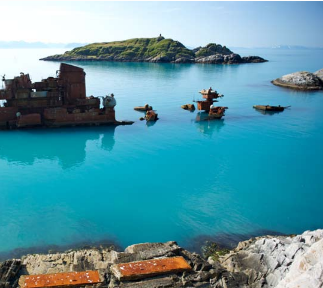
Krysseren "Murmansk" strandet i fjæresteinene utenfor Sørvær i Finnmark på julaften i 1994.