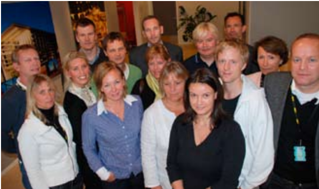
Redaktørene i forretningsenhetene er klare til å gi deg informasjon.