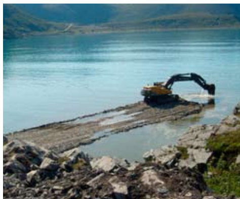
AF bygger både molo og tørrdokk for å løse oppdraget med å fjerne vraket av "Murmansk".