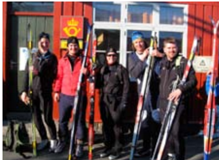
AF BIL satser på godt vær og god oppslutning blant AF'ere på Skarverennet 2010.

Det var tydeligvis energi i seilene til AF Energi & Miljøteknikk båten. For andre år på stakk de av med vandrepokalen i AFs seilregatta!