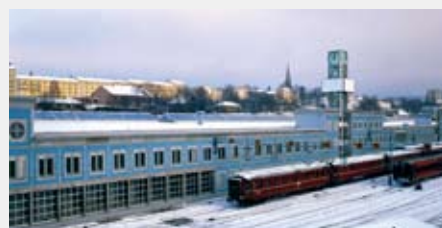
Her er bilde fra et av de første prosjektene til AF. 1986 - AF bygger Lodalen Driftsbanegård og Dam Dokkløyvatn. Konsernets omsetning var på 118 millioner kroner.

De som sitter på historiske godbiter kan sende disse til Kommunikasjon@afgruppen.no innen februar 2010.