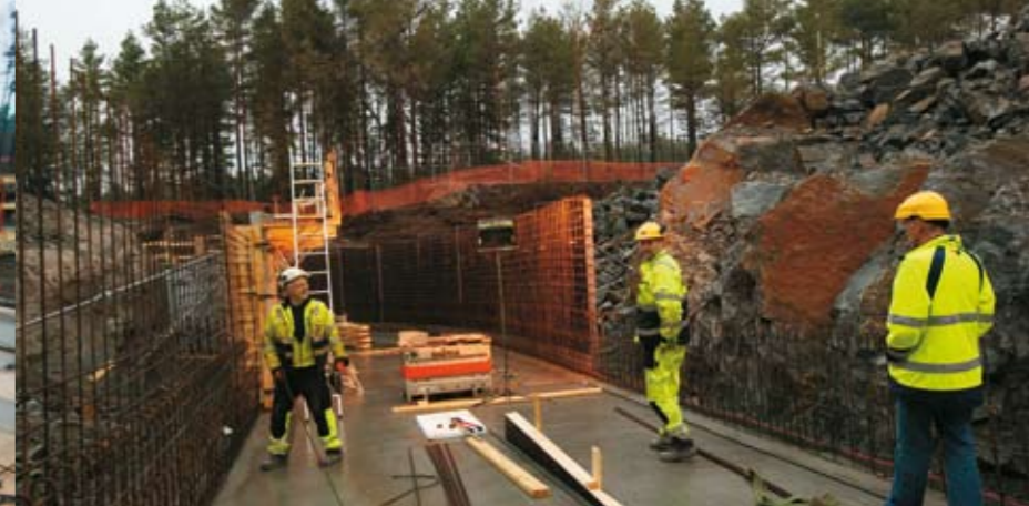
Den 450 meter lange underjordiske kulverten som skal brukes til transport og tekniske installasjoner, knytter sammen alle bygninger inne på fengselsområdet.