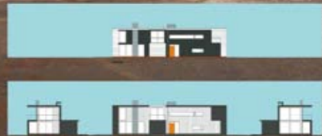
AF Bygg Syd prosjekt Skummelsløvsstrand utenfor Halmstad, 51 stk flotte boliger rett ved strandkanten, ferdig våren 2009.

AF Gruppen styrker sin satsning i Sverige og etablerer selskapet AF Bygg Syd AB i Halmstad i Syd-Sverige. Satsningen ble annonsert i forbindelse med kvartalspresentasjonen. Selskapet starter opp med 13 ansatte, hvorav 9 er innen produksjon. Antall ansatte vil øke i takt med oppdragsmengden.