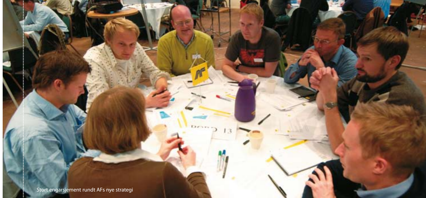
Stort engasjement rundt AFs nye strategi