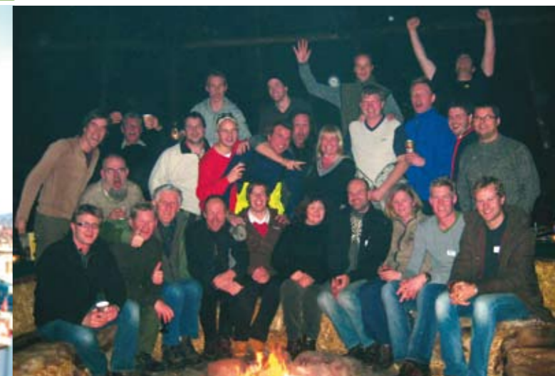
HMS-personell fra alle forretningsenheter i AF.