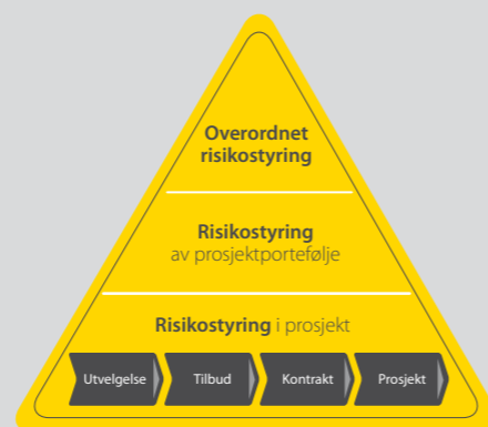
Helhetlig risikostyring: Risikostyringspyramiden illustrerer at en gjennomgang av risikoforholdene i prosjektene danner grunnlaget for risikoarbeidet i AF.